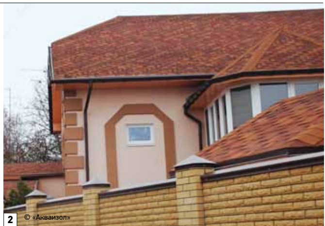
1–2. Благодаря небольшому весу (до 8 кг/м 2 ) и высокой гибкости битумная черепица как никакой другой кровельный материал подходит для крыш сложной конфигурации